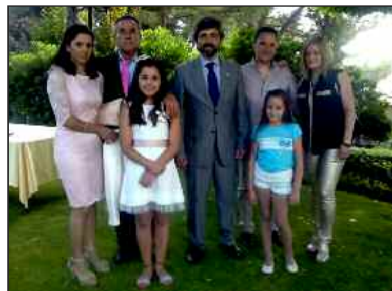
Las familias de las niñas premiadas con el alcalde en la embajada de Japón.

En el concurso de haiku, co-organizado por el Ayuntamiento de Coria del Río, a través de la Biblioteca Pública Municipal ‘Maestro Antonio Pineda’, han participado niños y niñas