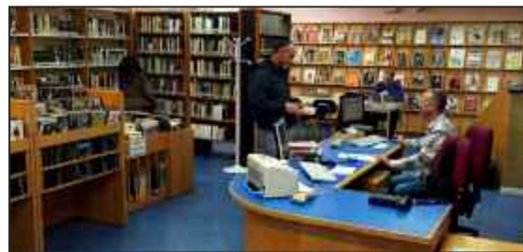
Biblioteca Municipal de Coria del Río.

“La Educación es uno de los pilares de la sociedad por lo que el acceso gratuito al conocimiento debe ser una de las prioridades de todo gobierno que trabaje por sus ciudadanos, así pues, a pesar de la difícil situa-