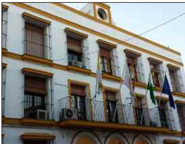
Ayuntamiento de Coria del Río.

“Nuestra colaboración con la justicia en éste y otros asuntos va a ser impecable. De hecho, a propuesta mía se está desarrollando una Comisión de Investigación en el seno del Ayuntamiento, a la que están acudiendo todos los partidos menos el PSOE, que también obstaculizó la creación durante más de un año y medio”, mani-