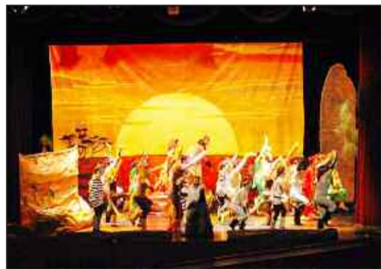
Uno de los momentos del espectáculo ofrecido en el Centro Cultural.