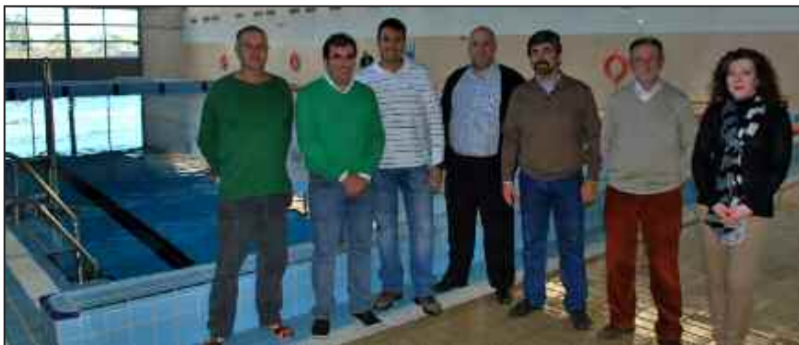
Miembros del Gobierno Local y del Club Deportivo Korah el día de la reapertura de la piscina cubierta.

"Próximamente vamos a aprobar la resolución de concurso público para la concesión de las piscinas corianas, pero como los trámites administrativos son tan arduos y lentos hemos firmado este acuerdo para que los corianos puedan disfrutar de la piscina climatizada desde ya", añaden desde el Ayuntamiento.